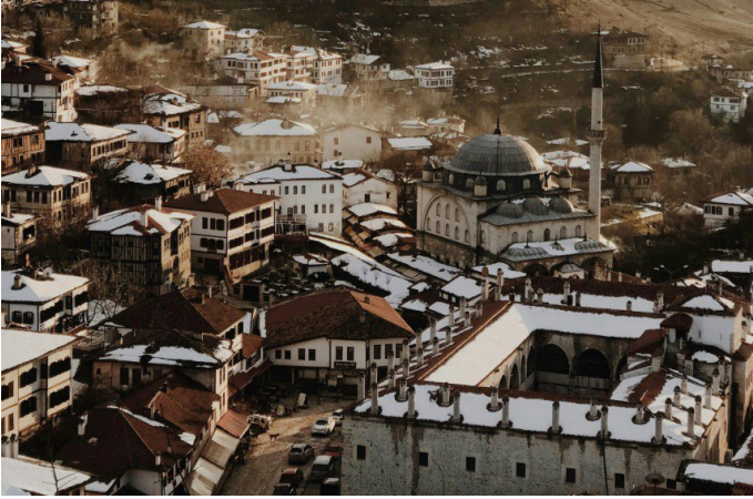
Safranbolu şehir manzarası

Yerli sosyal platform I Will ve Sosyalfest gibi projeler; Karabük'ün sadece geleneksel sanayi kenti kimliğinin ötesine geçerek teknoloji üretimi ve sosyal yenilik alanlarında da önemli bir merkez haline geldiğini kanıtıyor. Bu tür girişimler, şehrin genç nüfusuna yeni kariyer fırsatları sunarken Karabük'ü Türkiye'nin dijital haritasında daha görünür kılıyor. Özellikle üniversite mezunlarının kentte kalması ve burada teknoloji odaklı işler bulması açısından bu gelişmeler son derece önemli.