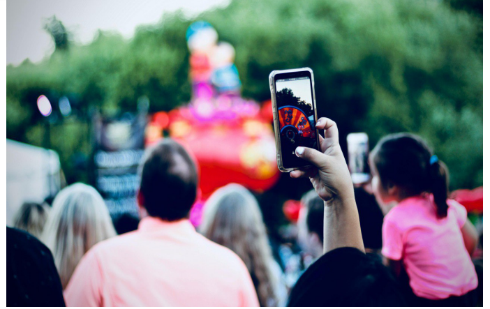
Temsili görsel- Dijital belediyecilik ve sosyala platformlar

I Will platformu, kullanıcılarına yalnızca bilgi akışı sağlamakla kalmıyor, aynı zamanda güvenli ve etkileşimli bir dijital sosyal alan sunarak yerel yönetim ile halk arasındaki bağı güçlendirmeyi hedefliyor. Yerli bir platform olması nedeniyle kullanıcı verileri yurt dışına çıkmıyor ve platformun altyapısı tamamen Türkiye'de geliştiriliyor. Bu durum, dijital egemenlik ve veri güvenliği açısından da önemli bir avantaj sağlıyor. Özellikle son yıllarda yabancı sosyal medya platformlarının veri güvenliği konusunda yaşadığı sorunlar göz önüne alındığında, yerli bir alternatifin varlığı daha da önem kazanıyor. I Will, kullanıcı gizliliğine verdiği önem, şeffaf veri politikaları ve Türk hukukuna tam uyumluluğu ile güvenli bir dijital ortam sunuyor.